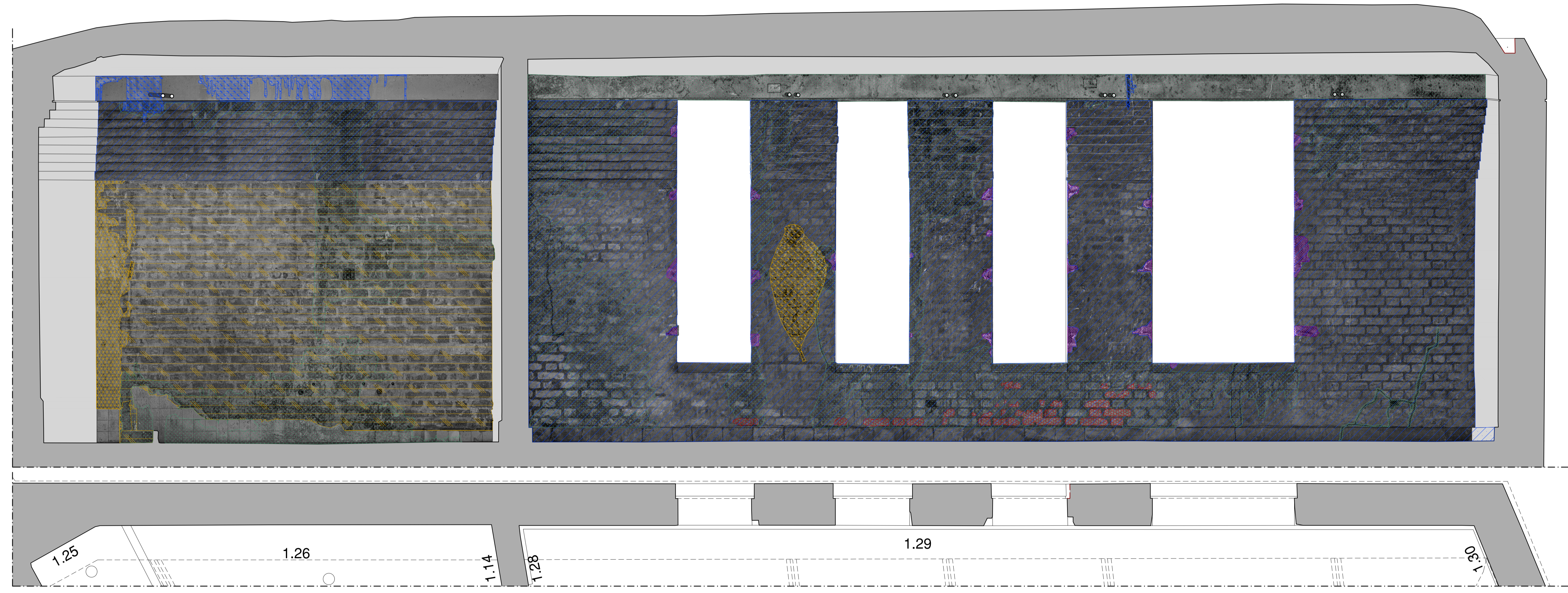
Paredes 26 y 29